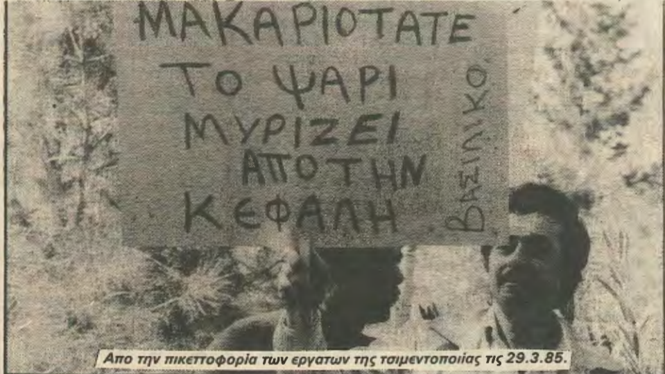
Απο την πικετοφορία των εργατων της τσιμεντοποιίας τις 29.3.85.